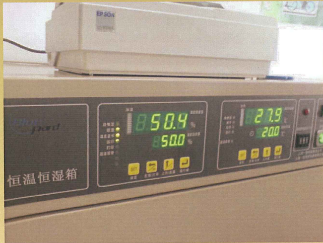
溫濕度控制示意圖

工作室尺寸(mm) WxDxH 600x405x620 外形尺寸(mm) WxDxH 750x800x1390